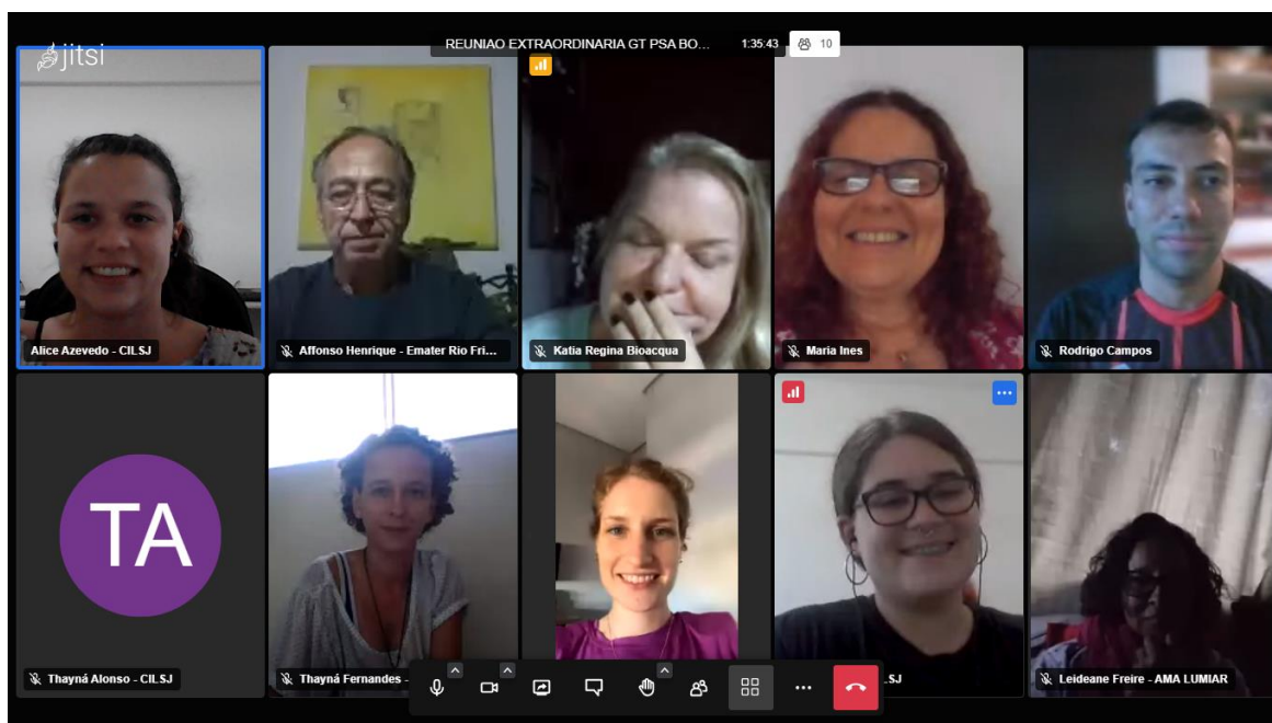
Figura 1: Registro da reunião do GT PSA em 25 de Outubro de 2022.

Não havendo mais nada a tratar, os presentes agradecem e a reunião se encerra às 16:54h.