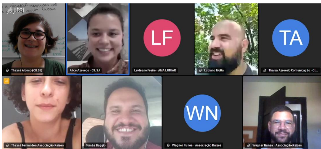
Figura 1: Registro da reunião de CTEACOM em 13 de Janeiro de 2023

Não havendo mais nada a tratar, os presentes agradeceram e a reunião encerrou-se às 12:33h.