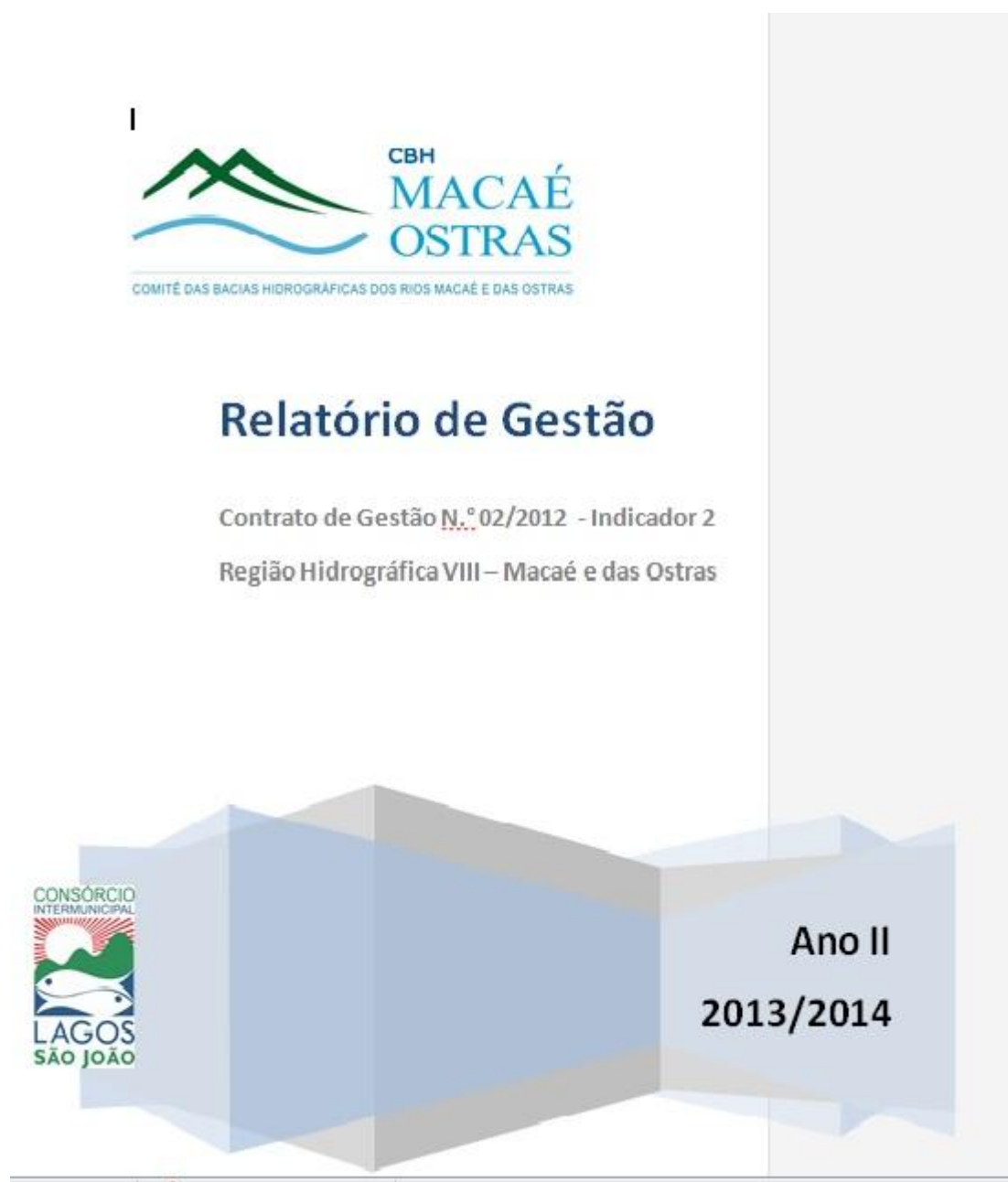
Figura 2- Capa do Relatório de Gestão - Ano II - 2013/2014