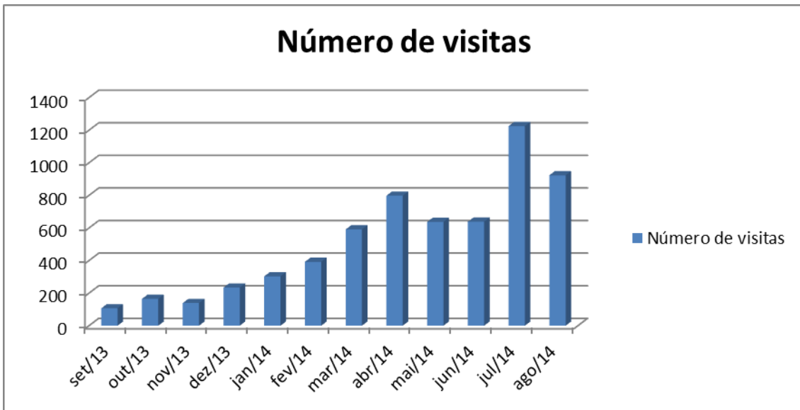
Gráfico 1 – Média mensal de acessos únicos no período de avaliação

Realizado: Média mensal de acessos únicos no período de agosto de 2013 a agosto de 2014 iguais a 473 acessos únicos.