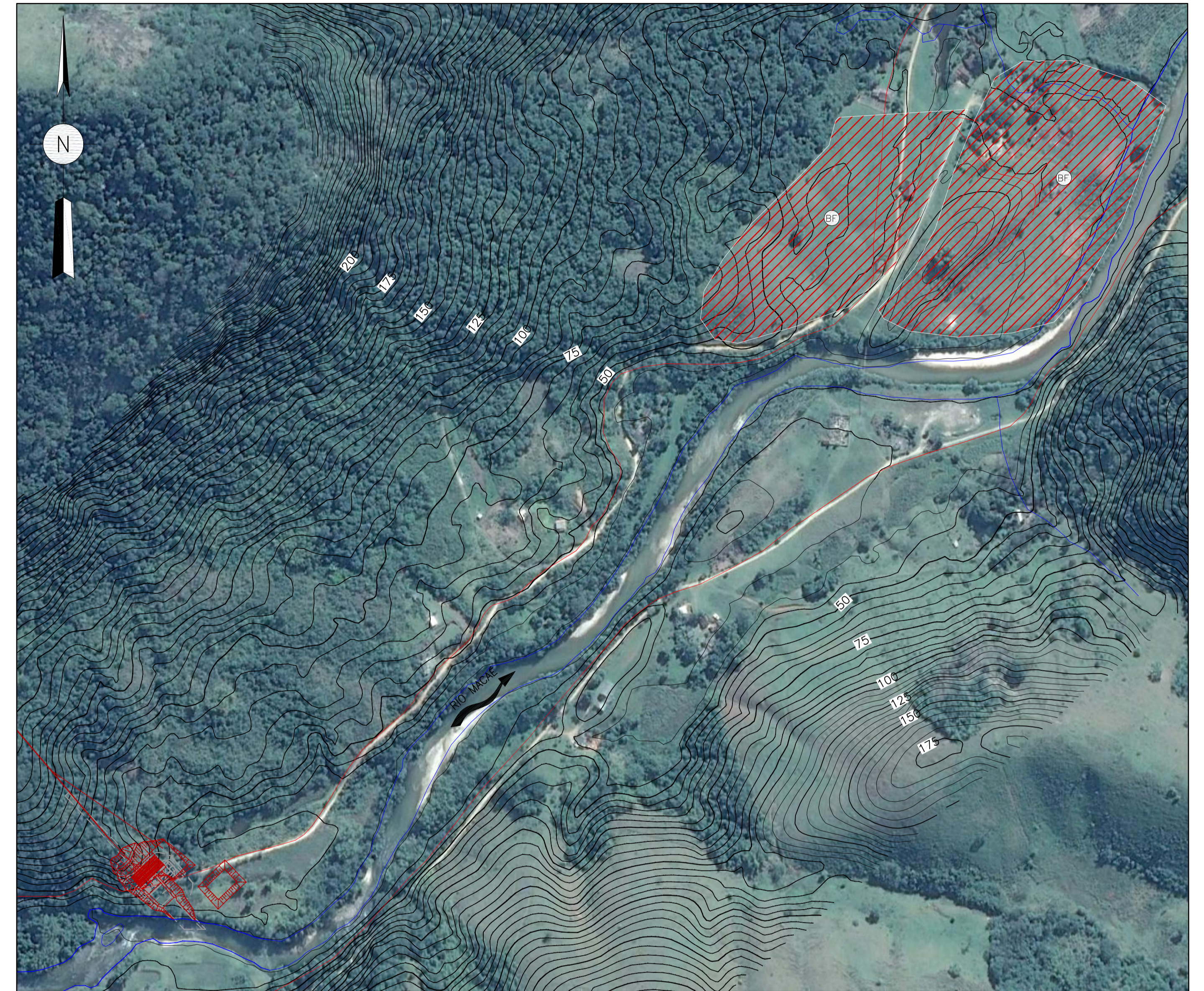
PLANTA - JUSANTE ESC. 1:4.000